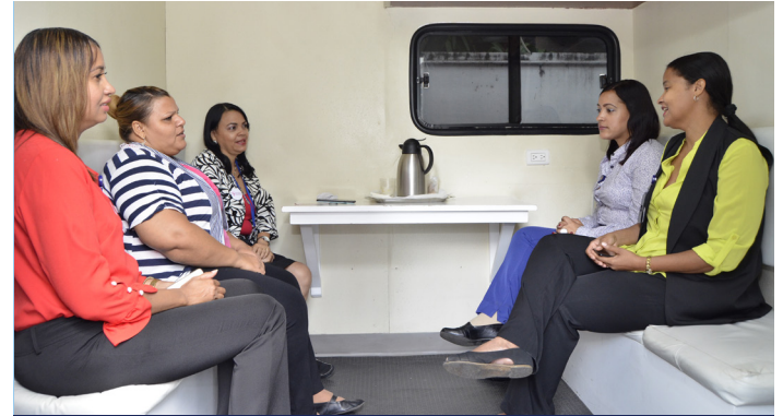
Operativo Salud de la Mujer