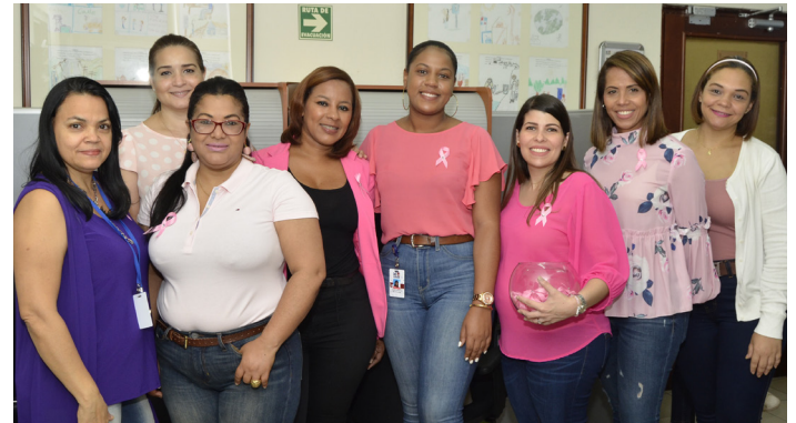
Día Mundial Contra el Cáncer de Mama