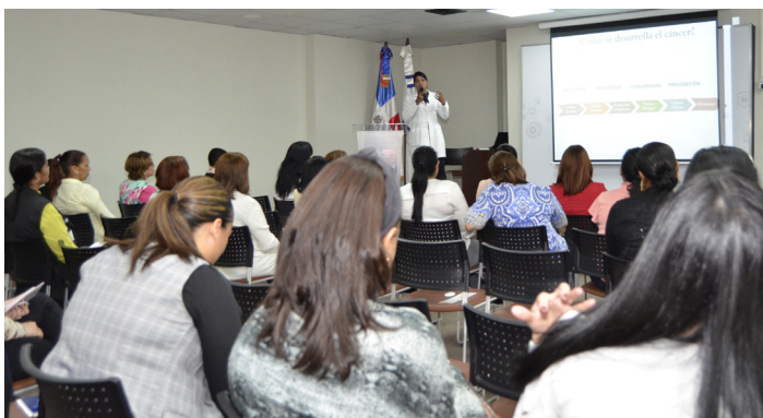
Charla mujeres saludables defiéndete sin temor del cáncer de mama