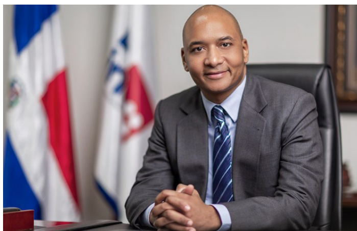
Prioridad del INDOTEL es organizar la llegada del 5G, entrevista para la edición especial "40 under 40" de la revista Mercado