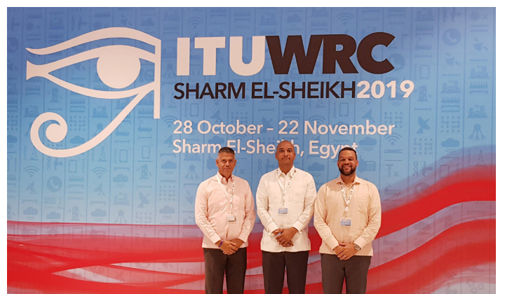
Conferencia Mundial de Radiocomunicación de la UIT