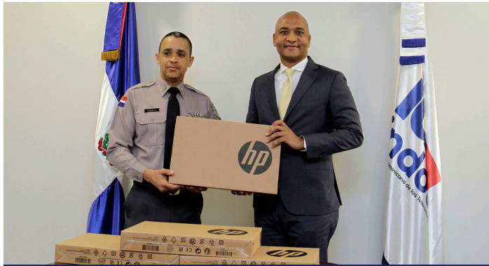
Donación de equipos computacionales al Instituto Policial de Educación (IPE) de la Policía Nacional