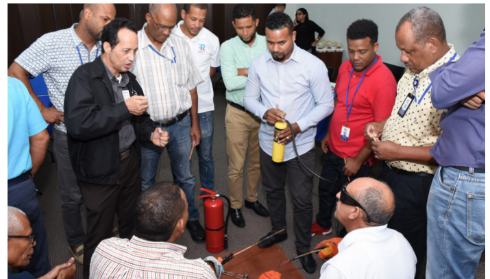
Conclusión curso de refrigeración