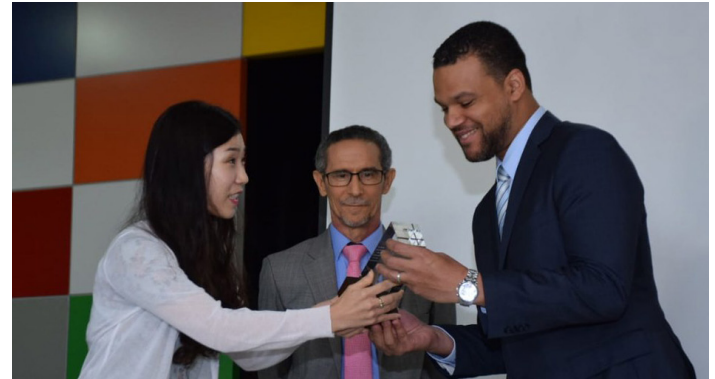
Indotel recibe placa de reconocimiento de la Asociación de Radiodifusores de Corea (RAPA)