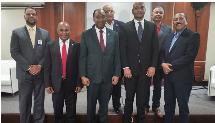
Presidente del Indotel informa a diputados acciones contra interferencia de emisoras haitianas