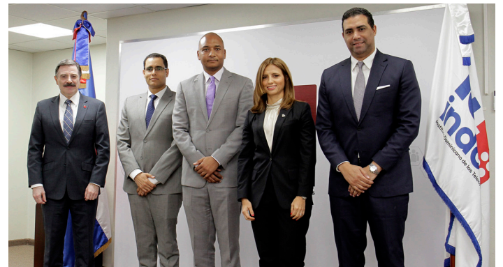
Indotel: Avanzamos en regulación del espectro para atraer inversión y expandir telecomunicaciones