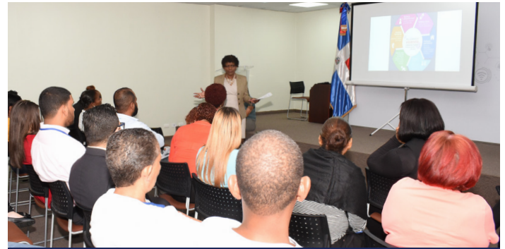
Conversatorio Violencia Doméstica