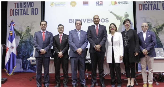
La Ciudad Colonial será el primer destino turístico inteligente de la República Dominicana