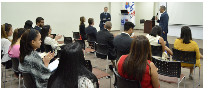
Charla Sobre Derecho y Competencia