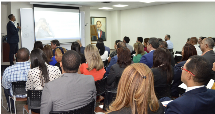
Charla “Correcto Uso de los Servicios Públicos de Telecomunicaciones”