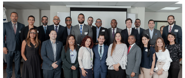
Indotel organiza mesa de ciberseguridad para asegurar integridad de los servicios críticos del país