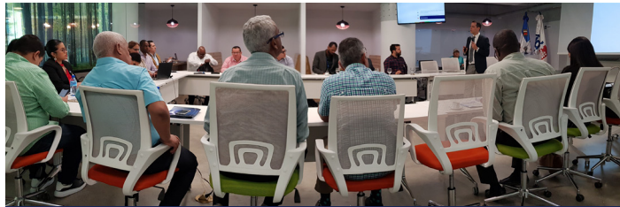
“Tendencias y Desafíos en la Nueva Gestión de Espectro”, impartido por el Centro de estudios Avanzados en Banda Ancha, CEABAD.