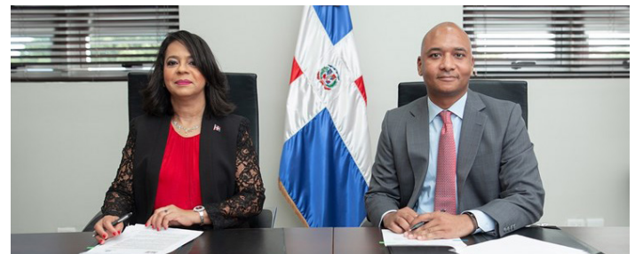
Usuarios de telecomunicaciones podrán presentar reclamos en Pro Consumidor