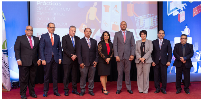
Indotel y Pro Consumidor presentan guía de protección al usuario de comercio electrónico