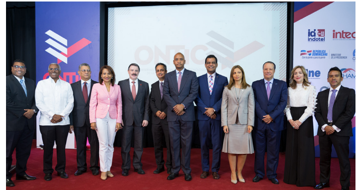
Presidente del Indotel presenta un nuevo observatorio para monitorear y fomentar el desarrollo de las TIC