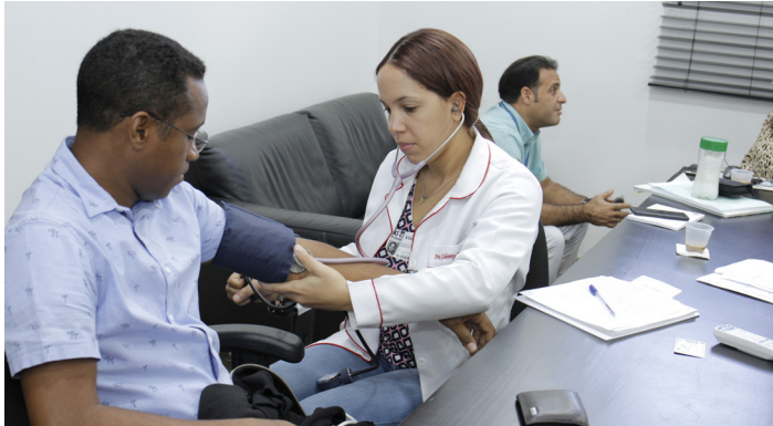
Jornada de salud cardiovascular