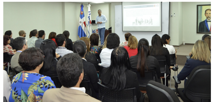
Taller de Compras