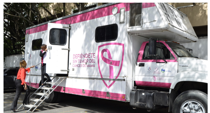
Operativo cáncer de mama