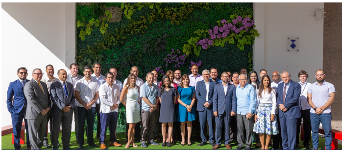
153 Reunión Ordinaria de la Comisión Técnica Regional de Telecomunicaciones COMTELCA