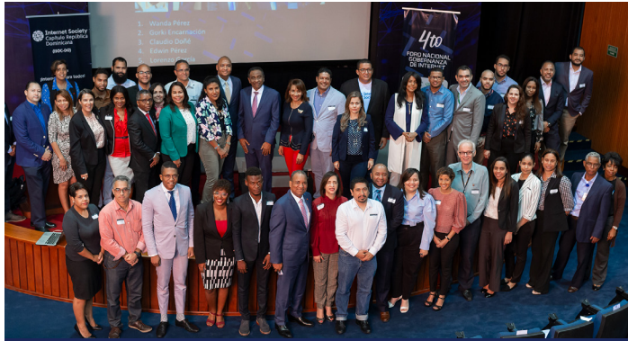
4to. Foro de Gobernanza de Internet de la República Dominicana