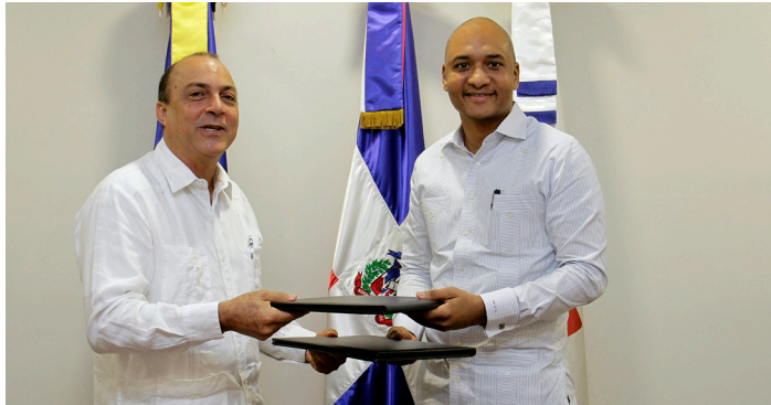
Indotel y Loyola digitalizarán biblioteca de San Cristóbal