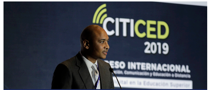
Indotel señala potencial de redes 5G para la educación en RD