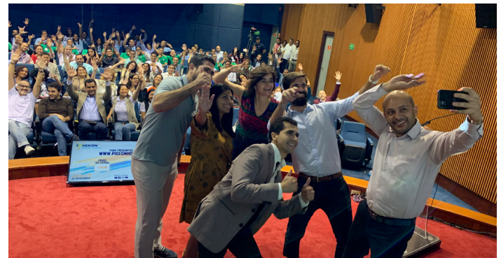
Conexión Silicon Valley