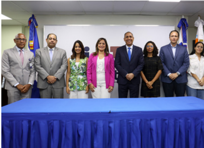
Acuerdo entre el Indotel y Fundación Nature Power