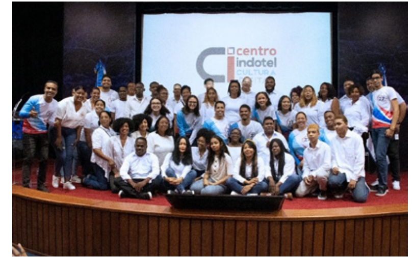
Participación del Indotel plan de expansión Cemex