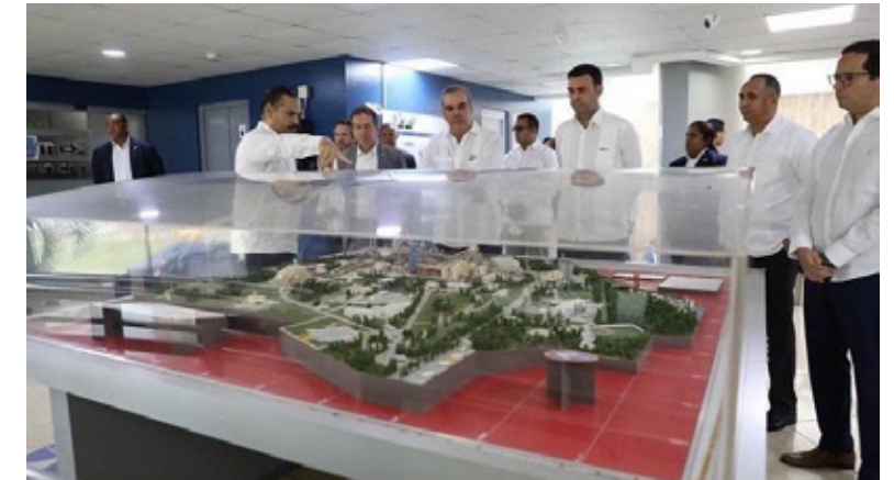
Participación del Indotel de la 41a reunión del Comité Consultivo Permanente de la Comisión Interamericana de las Telecomunicaciones