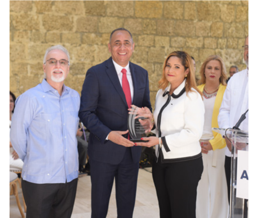
Reconocimiento al presidente del Indotel Nelson Arroyo de parte de la OGTC