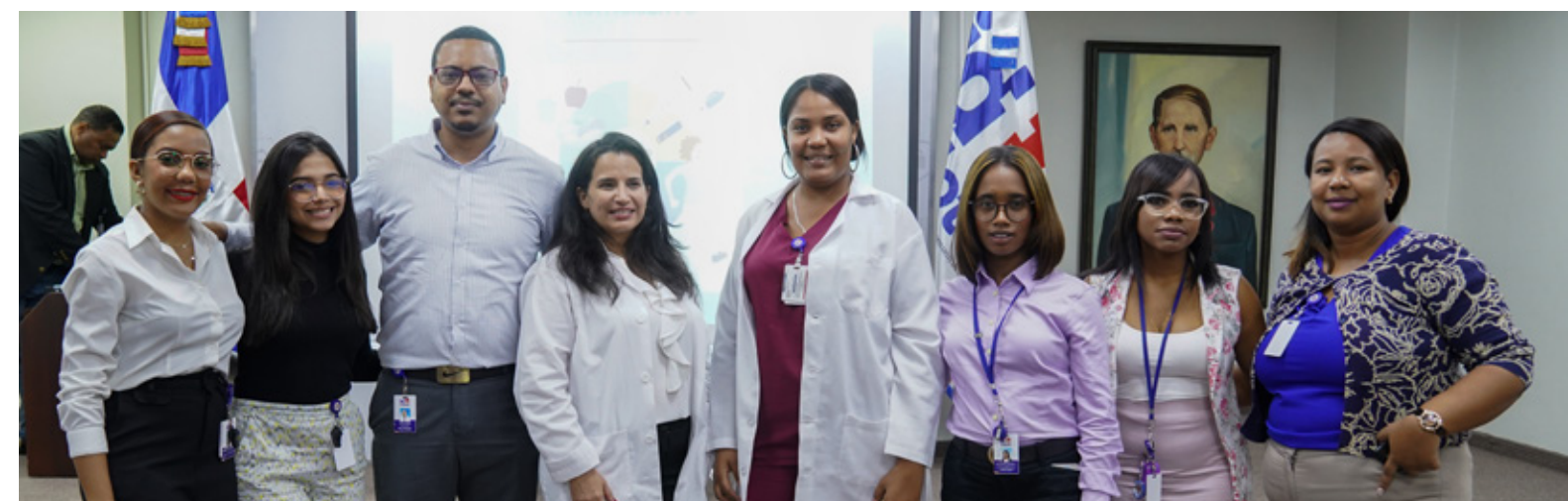
Taller ciberdelincuencia: Criptomonedas y lavado de activos