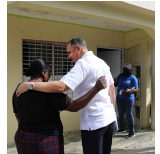
Entrega de becas a niñas de colaboradores y colaboradoras del Indotel