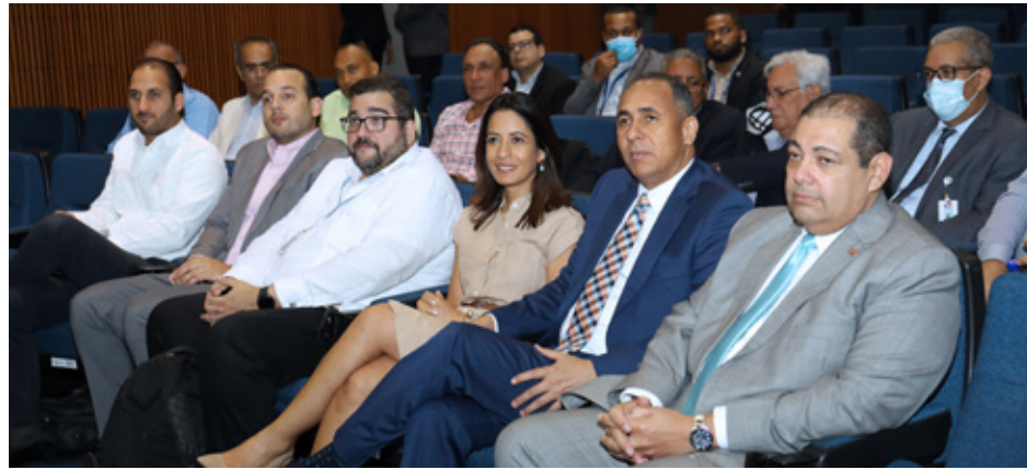
Mesa técnica Radiodifusores