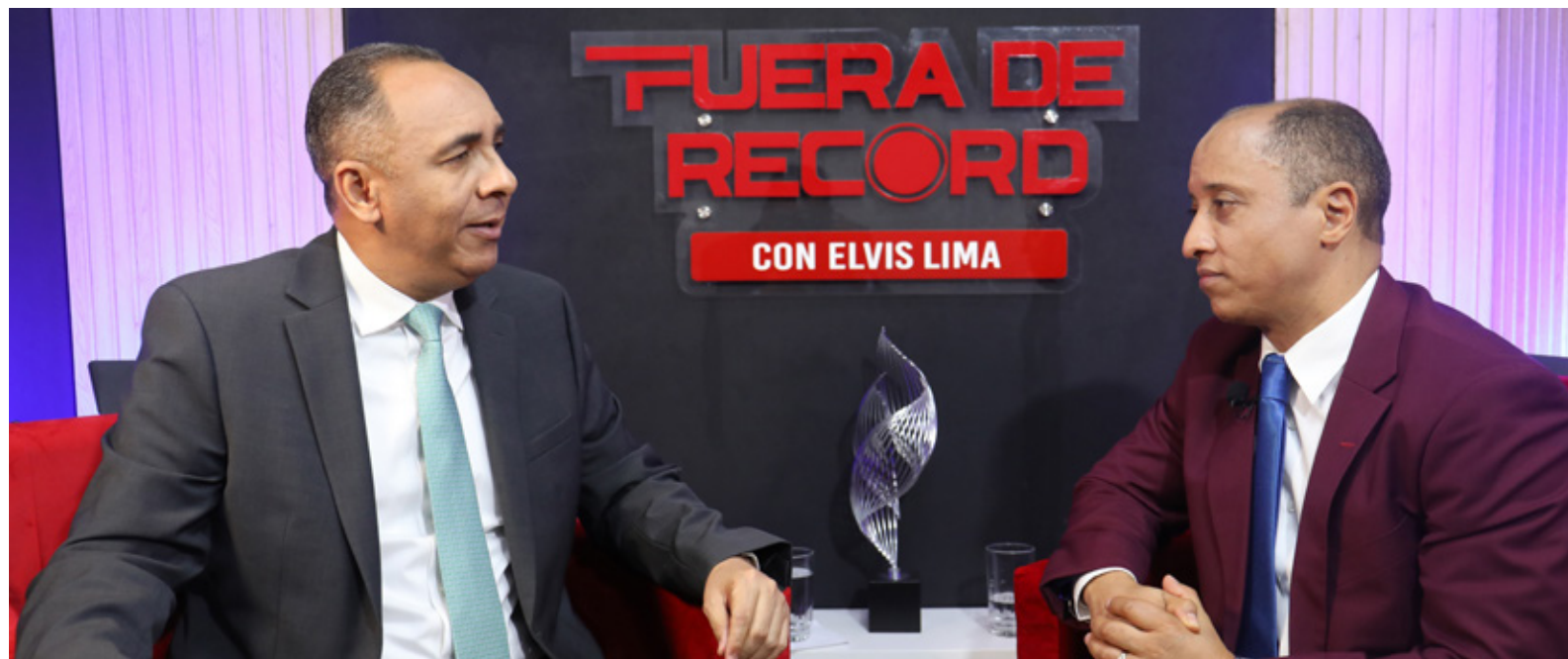
Entrevista en el programa "Fuera de Récord"