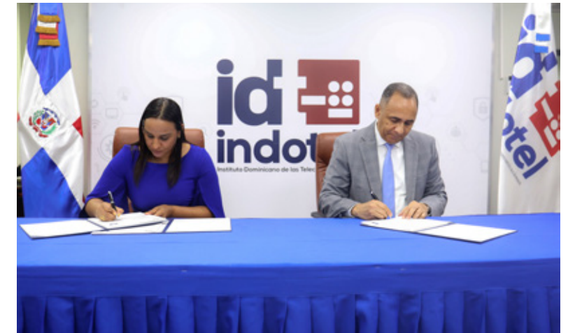
Firma entre el Indotel y Pro-Dominicana