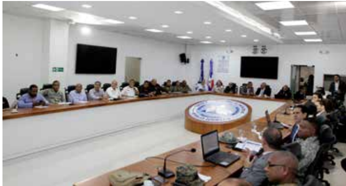
Indotel y COE aumentarán capacidad de servicios de telecomunicaciones ante desastres naturales