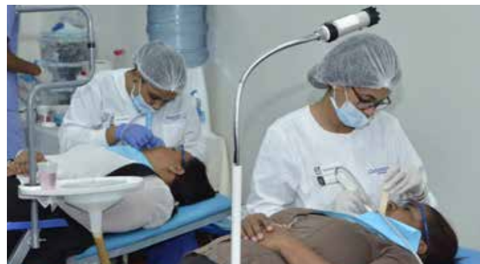
Operativo Odontológico Realizado por Odonto-Tec