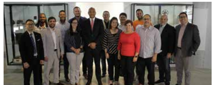
Presidente Guillen se reúne con bloggers