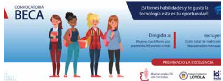
Indotel y Loyola ofrecen 21 becas para mujeres en carreras tecnológicas