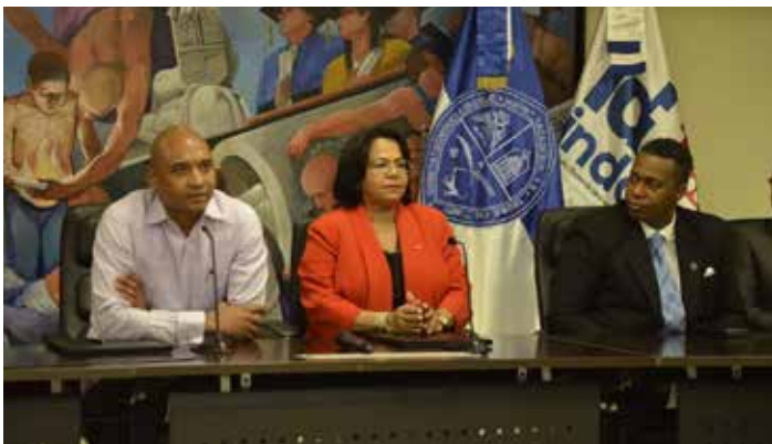
UASD e INDOTEL firman Carta de Intención como antesala de pacto para promoción y uso de las TICs