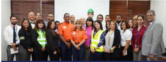
Capacitación en Primeros auxilios por la Escuela Nacional de Gestión de Riesgos de la Defensa Civil