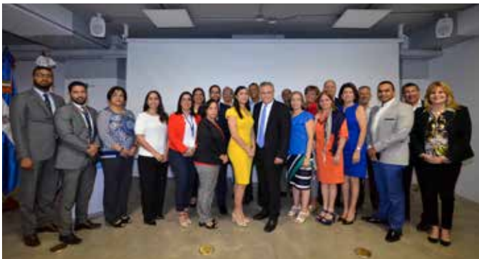
Protección al Usuario realiza foro de los Cuerpos Colegiados con miras a eficientizar procesos