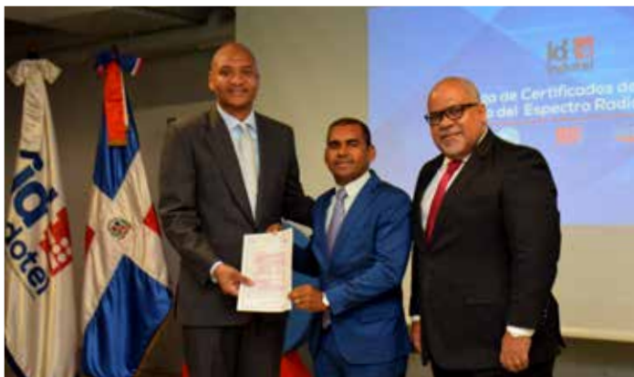
Entregan 124 certificados de licencia para uso del espectro radioeléctrico