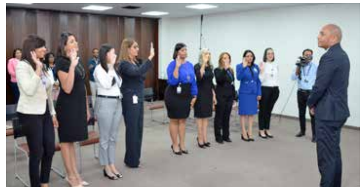
Juramentación de la Comisión de Ética Pública