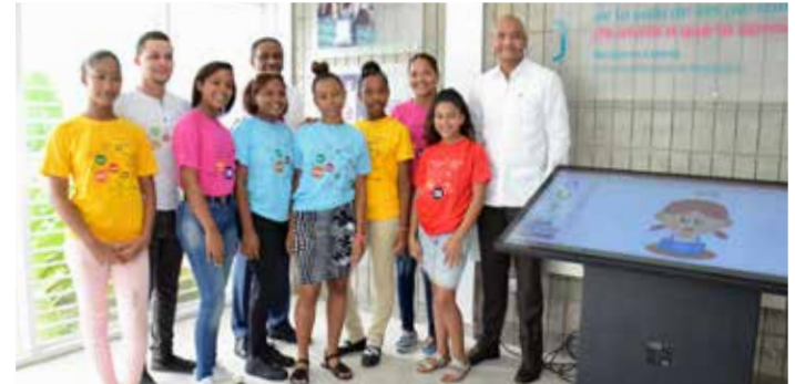
Indotel junto al Gabinete de Coordinación de la Política Social (GCPS) de la Vicepresidencia de la República firman convenio "CTC MakerSpaces", espacios tecnológicos que benefician a miles de jóvenes.