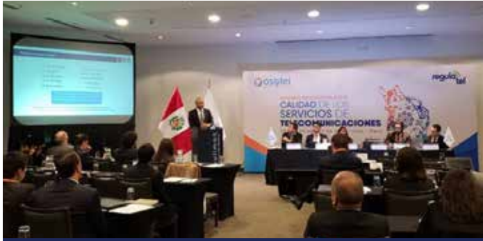
Participación de INDOTEL en el Seminario Internacional sobre Calidad de los Servicios de Telecomunicaciones, celebrado en Lima, Perú.