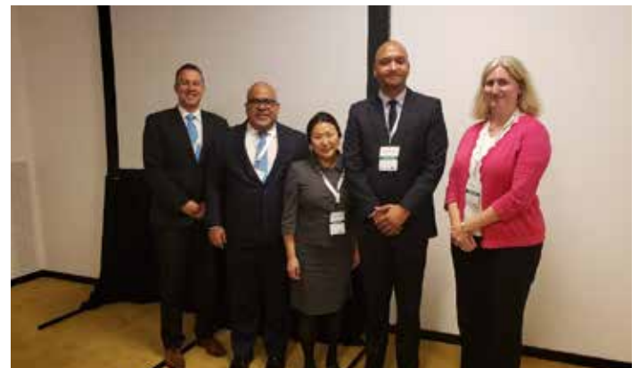
Presidente del Indotel expone preparativos para llegada de la red 5G a RD durante el VII Congreso Latino Americano de Telecomunicaciones en Cordoba, Argentina.