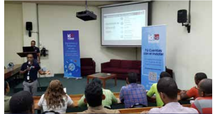
Continúan las charlas Tu Cuentas con el Indotel en tres provincias del país