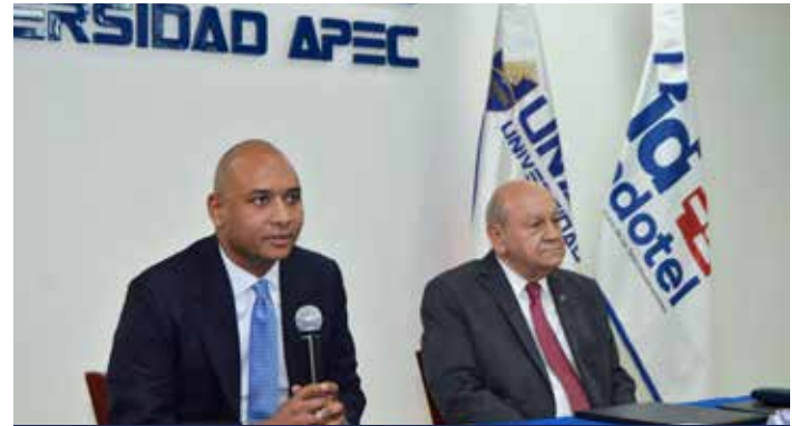
Indotel y UNAPEC firman convenio para impulsar programas académicos y pasantías