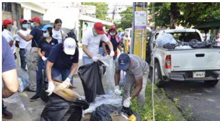
Protección medioambiental Dominicana Limpia. Zona Universitaria