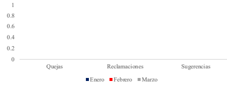
Sistema de Atención Ciudadana 311 de Quejas, Reclamaciones y Sugerencias Primer Trimestre 2023