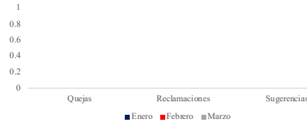
Sistema de Atención Ciudadana 311 de Quejas, Reclamaciones y Sugerencias Primer Trimestre 2023