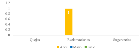
Sistema de Atención Ciudadana 311 de Quejas, Reclamaciones y Sugerencias Segundo Trimestre 2023